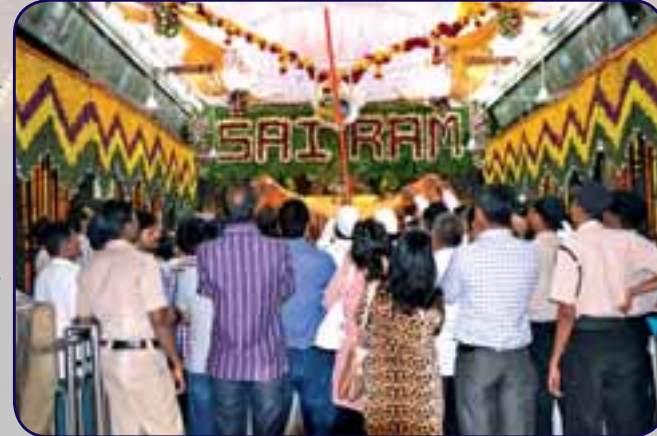
समाधिमंदिरात दहीहंडी कार्यक्रम...

प्रकाशक व मुद्रक कार्यकारी अधिकारी यांनी श्री साईबाबा संस्थान विश्वस्तव्यवस्था (शिर्डी) करिता मे. टॅको व्हिजन्स प्रा. लि., ३८ ए व बी, गव्हर्नमेंट इंडस्ट्रियल इस्टेट, चारकोप, कांदिवली (प.), मुंबई - ४०० ०६७ येथे छापून साईनिकेतन, ८०४ बी, डॉ. आंबेडकर मार्ग, दादर, मुंबई - ४०० ०१४ येथे प्रकाशित केले. संपादक : कार्यकारी अधिकारी, श्री साईबाबा संस्थान विश्वस्तव्यवस्था (शिर्डी)